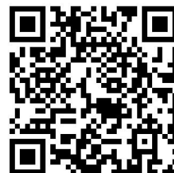
违规禁办事项清单